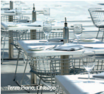
Terzo Piano, Chicago

Durat on kotimainen, Suomessa kehitetty massiivilevy, josta valmistetaan erilaisia tasoja ja tiskejä. Se kestää hyvin kulutusta, kosteutta ja erilaisia kemikaaleja. Durat soveltuu erinomaisesti tasomateriaaliksi niin julkisiin kuin yksityistiloihinkin. Esimerkiksi ravintolat, kahvilat, myymälät, sairaalat ja laboratoriotilat, kylpyhuoneet, wc-tilat, laivat, veneet sekä yksityis- ja suurkeittiöt ovat oivallisia Durat-tason käyttökohteita.