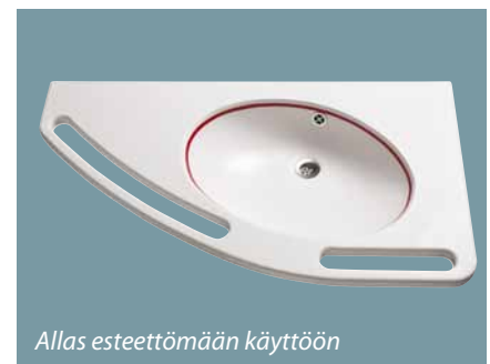
Allas esteettömään käyttöön