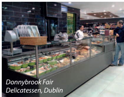
Donnybrook Fair Delicatessen, Dublin